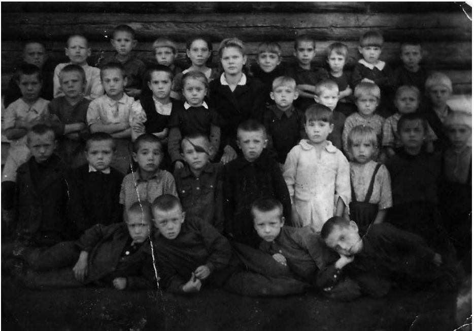
Ученики Лучшевской школы. Первый класс.

Спасибо тесным коридорам, Где не смолкали шум и смех, Спасибо классам, столь просторным, Учеников вместивших всех. Не зарастет тропинка к школе, И в окнах не погаснет свет, Здесь не закончатся уроки Премного, много, много лет. Как ни любить мне школу эту, Как много сделала она, И, как маяк, манящим светом Вошла в историю села.