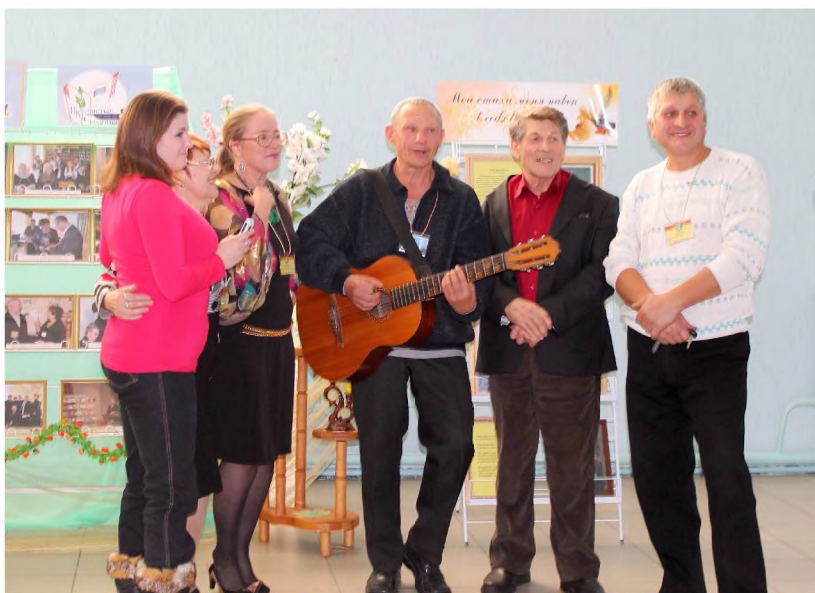
Фойе Новосафоновского ДК. Перерыв в работе поэтического фестиваля.

Какое время года я люблю, не знаю. Скажу, как есть, душою буду чист. Зима и лето хороши, весну вдыхаю, Но все же по душе – осенний лист!