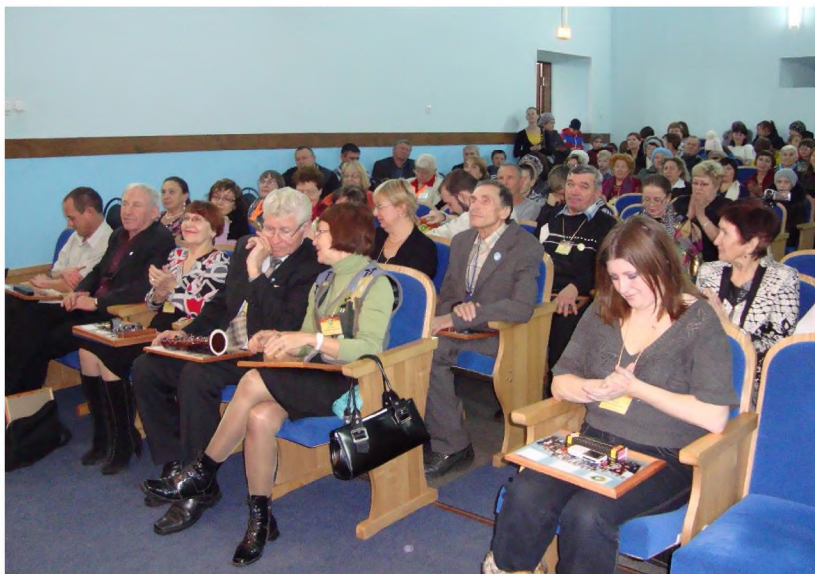
Участники поэтического лагеря “Вдохновение” на поэтическом вечере в Трудармейском Доме культуры.

Вот поднимают гроб на плечи Ребята из конторы «Ритуал». Я медленно плыву навстречу Реальности с названием «Финал». В процессии никто не плачет, Поминки предвкушают и судачат. Всё это для меня не важно. Я знаю, был далёк от идеала. Но яблонька, что мной посажена, Представьте, плодоносить стала! Ещё, во искупление грехов, Я предъявлю тетрадочку стихов.