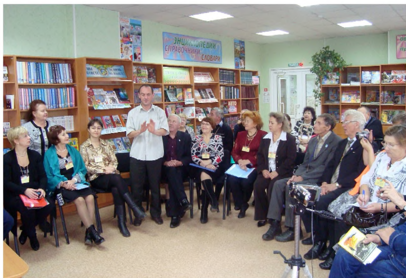
Творческая мастерская в Трудармейской модельной библиотеке.

Я не умею юлить, Зато умею терпеть. Мне научиться бы - жить, Чтоб ни о чём не жалеть!